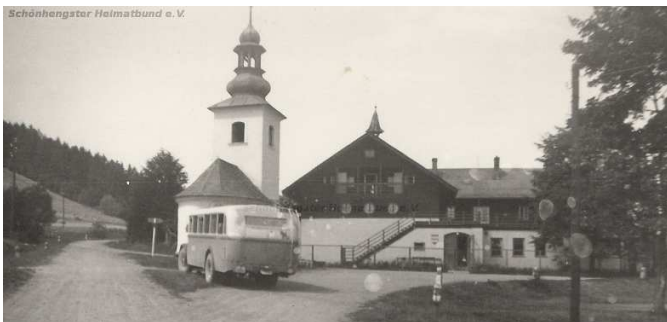
Kaplička na Svojanově údajně znemožňovala otáčení autobusu

Ten základní vzor české či německé vesnice našeho kraje máme všichni uložen v paměti s ladovskou přesností a poetikou. Návés obklopená obytnými domky s vjezdem do dvora s chlévy, stodolou a s dalšími zařízeními zemědělské technologie. Uprostřed kulaté či obdélníkovité návsi byl rybník, škola, hospoda a obecní úřad. A jako dominanta s věží vztyčenou jako varovný ukazovák vzhůru k nebi zde stála kaplička, která však zdaleka neplnila jen svůj náboženský úkol. Sloužila jako místo společenských kontaktů, večerních besed a sborového zpěvu (televizi tenkrát neměli a tak si museli vystačit sami), dětských her a taky randění. Před kapličkou se vzdycky postavil obecní zřízenec s bubnem, když dostal od starosty za úkol vybubnovat něco důležitého, jako byla třeba kontumace psů a koček, zápis do školy a také vyhlášení mobilizace. Věžička kaple byla pocestným již zdáli orinetačním bodem a zvon oznamoval nejen poledne a večerní klekání, ale sloužil také jako umíráček. Uvnitř pak bývaly vystaveny nejvzácnější obecní artefakty jako byl oltář, oltářní obraz a dřevěné figurky - většinou výrobky místních řezbářů. O velikonocích zde byl vystaven boží hrob a o vánocích betlém. Vše mělo svou roli a své místo. Válkou a to-