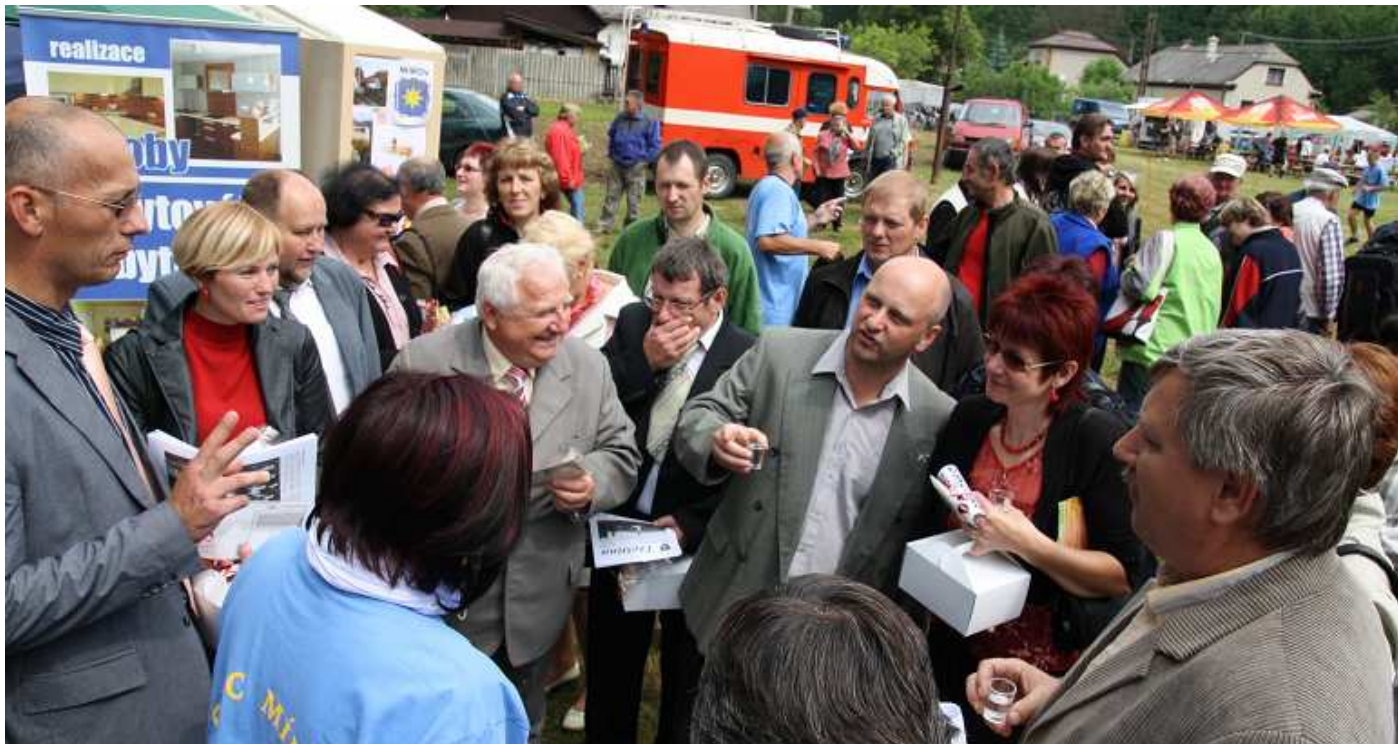
Neformální schůzka starostů Mikroregionu Mohelnicko se konala v Polici v sobotu 2. června 2012 pod širým nebem přímo mezi stánky